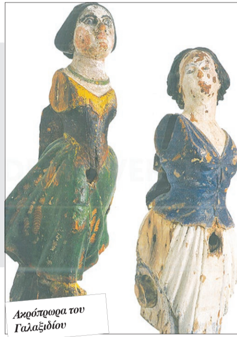
Ακρόπρωρα του Γαλαξιδίου