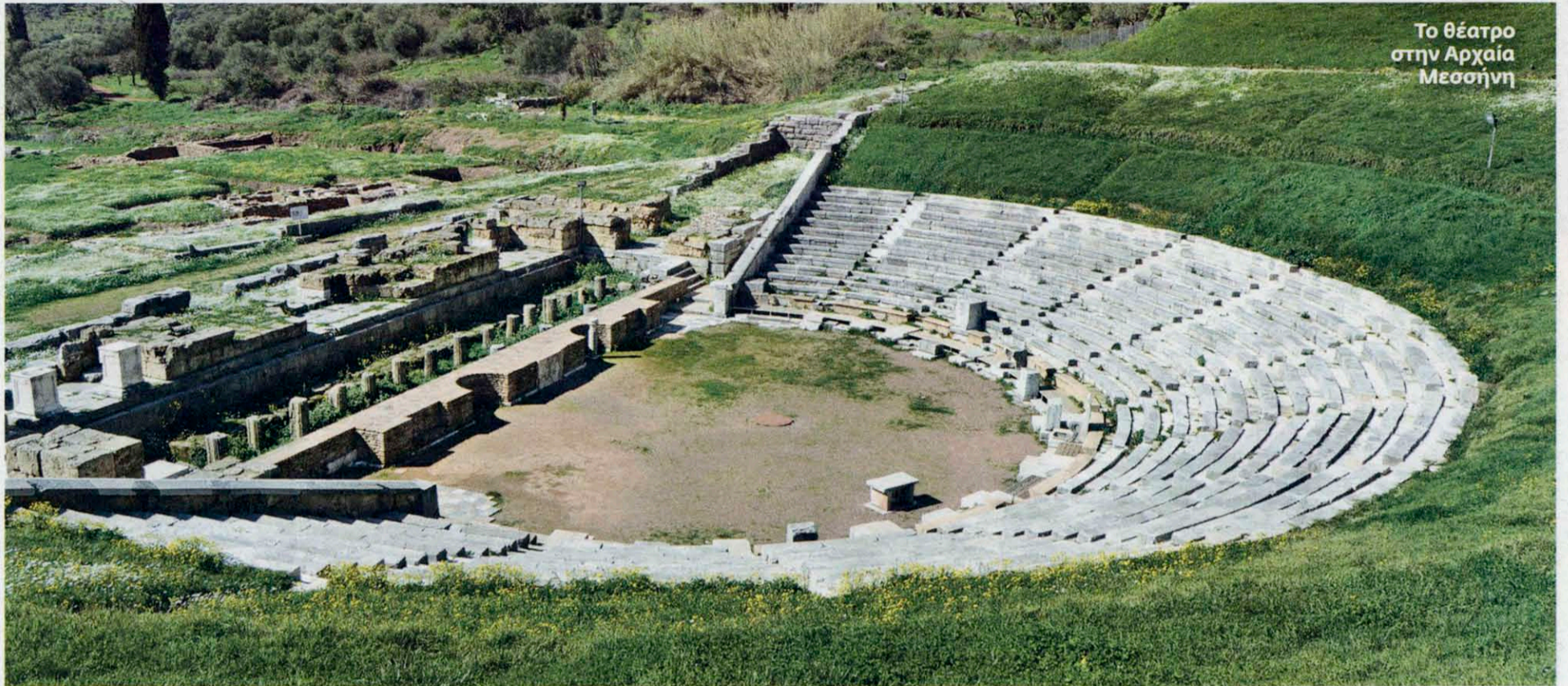
Το θέατρο στην Αρχαία Μεσσήνη