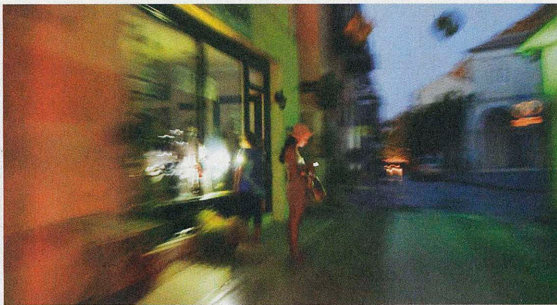
«Ρομαντική» απεικόνιση του Ναυπλίου, ύστερα από διακοπή ρεύματος εξαπτίας πυρκαγιάς σε υποσταθμό της ΔΕΗ.