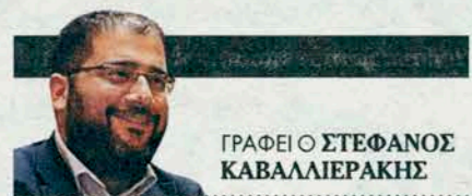
ΓΡΑΦΕΙ Ο ΣΤΕΦΑΝΟΣ ΚΑΒΑΛΛΙΕΡΑΚΗΣ

Η αφήγηση των τριών πρώτων φάσεων του νεότερου ελληνικού κράτους μέσα από θεματικά λήμματα και τη στοχαστική εκλαϊκευτική γραφή της συγγραφέως στο «Αλφαβητάρι της νεοελληνικής ιστορίας»