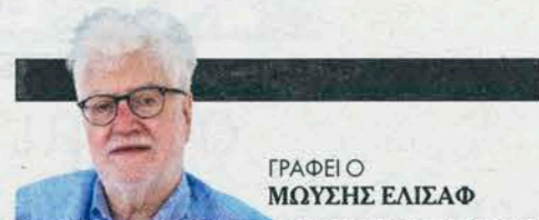
ΓΡΑΦΕΙ Ο ΜΩΥΣΗΣ ΕΛΙΑΣΦ

«ΤΟ ΠΑΝΟΡΑΜΑ ΤΟΥ ΝΙΣΗΜ ΛΕΒΗ» / ΕΚΔ. ΚΑΠΟΝ