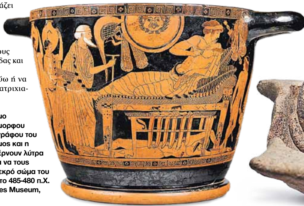
ΤΗΣ ΜΑΙΡΗΣ ΑΔΑΜΟΠΟΥΛΟΥ

Από τον διάκοσμο απτικού ερυθρόμορφου σκύφου του ζωγράφου του Βρύγου: ο Πρίαμος και η συνοδεία του φέρνουν λύτρα στον Αχιλλέα για να τους παραδώσει το νεκρό σώμα του Εκτορα. Γύρω στο 485-480 π.Χ. Kunsthistorisches Museum, Βιέννη