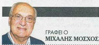
ΓΡΑΦΕΙΟ ΜΙΧΑΗΛ ΜΟΣΧΟΣ

Η ευσύνοπτη καταγραφή για το χρονικό του 1922, που αποκτά νέα διάσταση ενόψει της συμπλήρωσης ενός αιώνα από την Καταστροφή, την επόμενη χρονιά