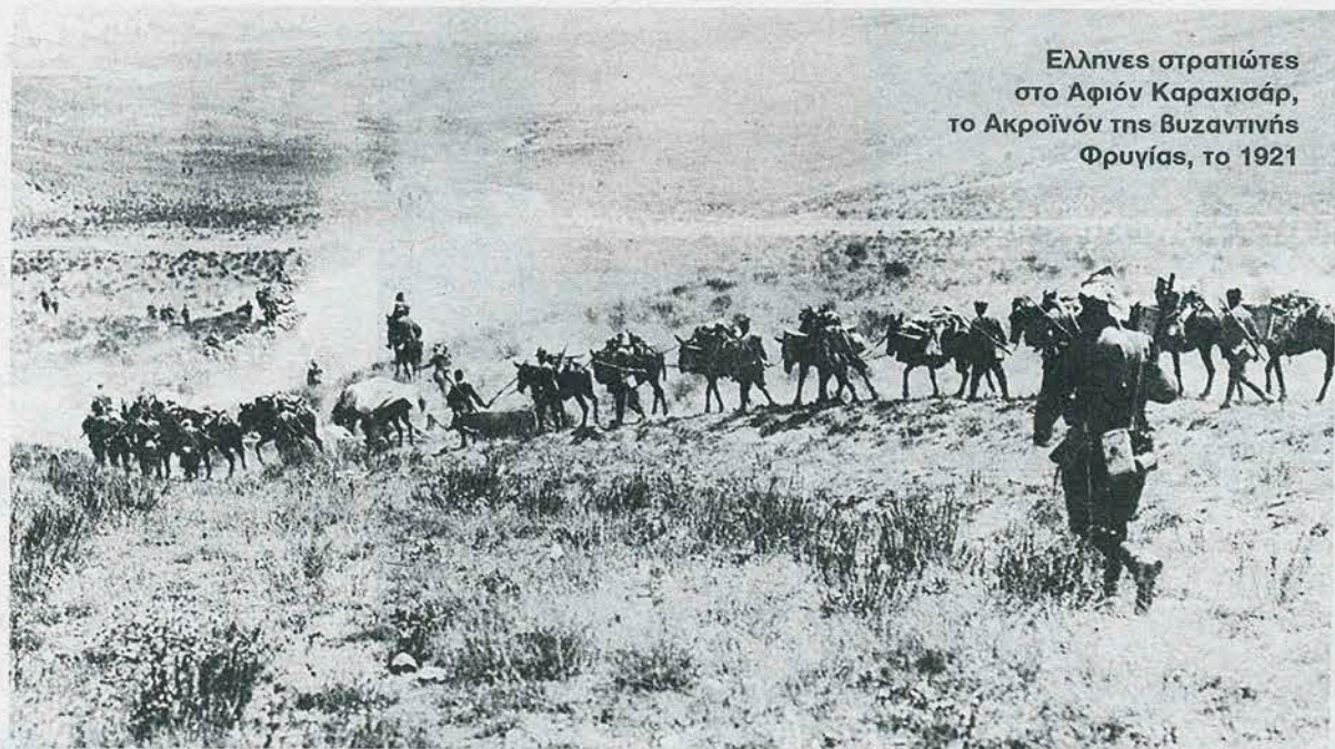
Έλληνες στρατιώτες στο Αφιόν Καραχισάρ, το Ακροϊνόν της Βυζαντινής Φρυγίας, το 1921

Η δημιουργία ενός δεύτερου μετώπου στην Ανατολή άρχισε να απασχολεί τους συμμάχους της Entente το 1914. Η τραγικά ανεπιτυχής εκστρατεία στα Δαρδανέλλια το επόμενο έτος εναντίον του άξονα Γερμανίας - Τουρκίας προδιέγραψε για τη μικρή, φτωχή Ελλάδα την αδήριτη ανάγκη να μείνει κατά το δυνατόν ουδέτερη, επιφυλακτική, ενωμένη μέχρι να τελειώσει ο Μεγάλος Πόλεμος. Αυτό η Ελλάδα δεν το κατάφερε – ούτε καν προσπάθησε να το κάνει ομονοώντας και εκτιμώντας ψύχραιμα τους προφανείς κοινούς κινδύνους. Αντίθετα, κατάφερε να