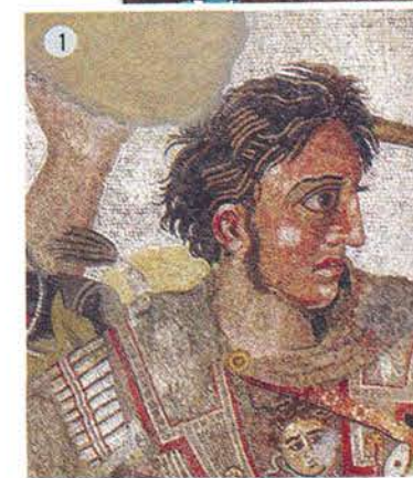
1. Αλέξανδρος, Διακρίνονται οι τονισμοί των όγκων με φωτεινές «πινελιές» και σπληνότητα. Πομπηία, Οικία του Φαίνου, ψηφιδωτό του Αλεξάνδρου (λεπτομέρεια). 2. Κρινάκια. Ακρωτήρι θήρας, Οικία Γυναικών, Δωμάτιο