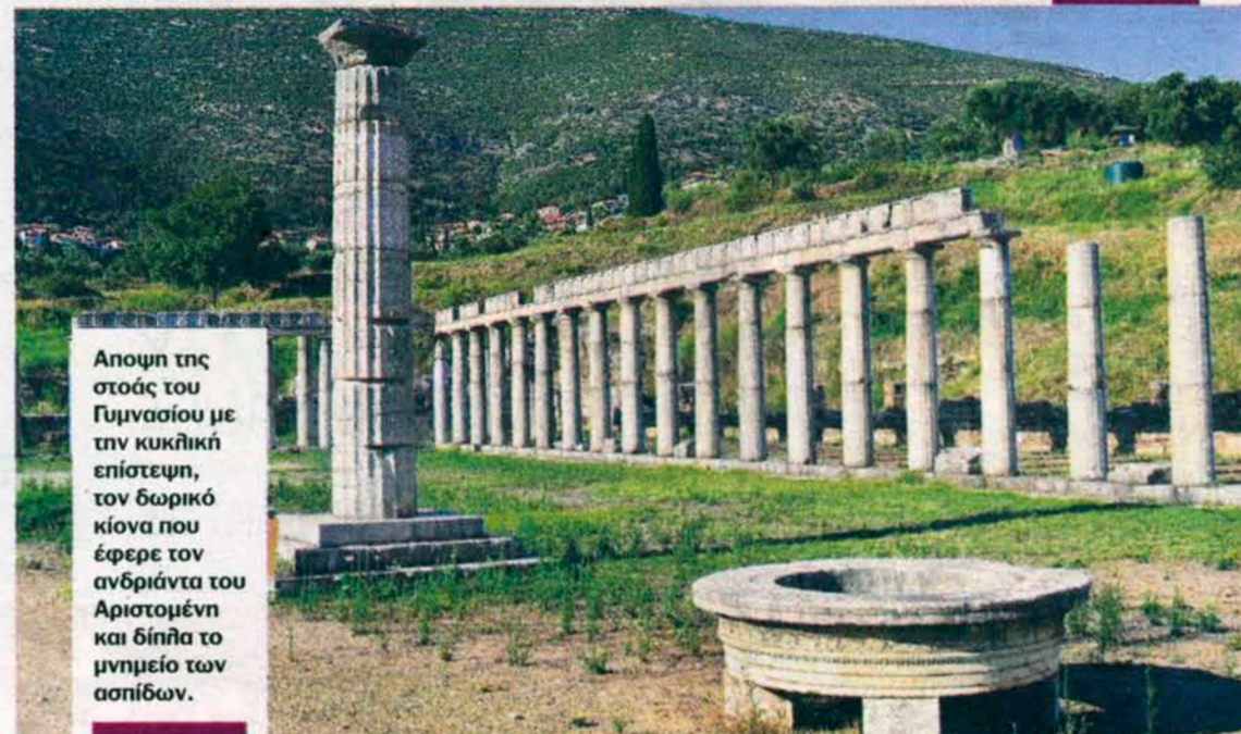
Αποψη της στοάς του Γυμνασίου με την κυκλική επίστεψη, τον δωρικό κίονα που έφερε τον ανδριάντα του Αριστομένη και δίπλα το μνημείο των ασπίδων.