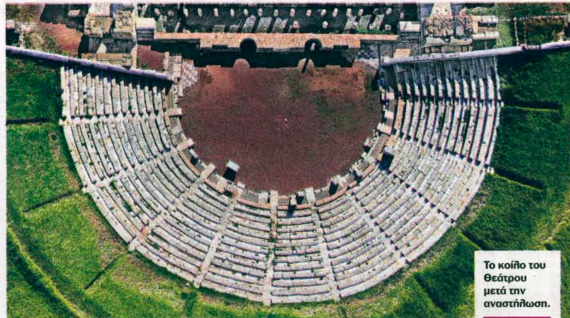
Το κούφο του Θεάτρου μετά την αναστήλωσή.

ΣΕΛΙΔΕΣ | 144 ΕΙΚΟΝΕΣ | 196 ΕΚΔΟΣΕΙΣ | «ΚΑΠΟΝ»