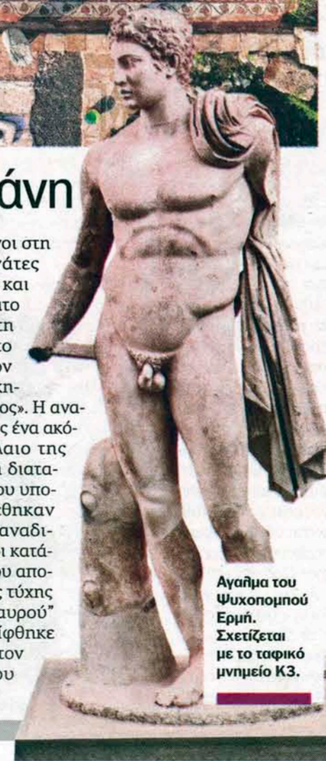
Αγαθή του Ψυχοπομπού Ερμή. Σχετίζεται με το ταφικό μνημείο Κ3.

Ο κ. Θέμελης τα λέει σαράτα: «Το κράτος πρέπει να βελτιώσει τις υποδομές για να βελτιώσει τα έσοδά του. Να βελτιώσει τη φύλαξη, την πυρασφάλεια». Κατά τα λοιπά, οι εργασίες στον χώρο δεν τελειώνουν ποτέ. Η αναστήλωση μιας στοάς στην Αγορά και οι αισθητικές επεμβάσεις στις όψεις κτιρίων που είχαν ανασκαφεί παλαιότερα, βρίσκονται αυτόν τον καιρό στο πρόγραμμα του ακουράστου αρχαιολόγου. ■