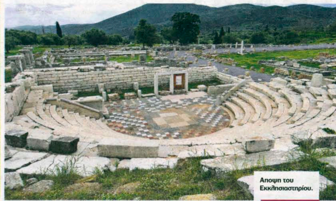
Αποψη του Εκκλησιαστήριου.