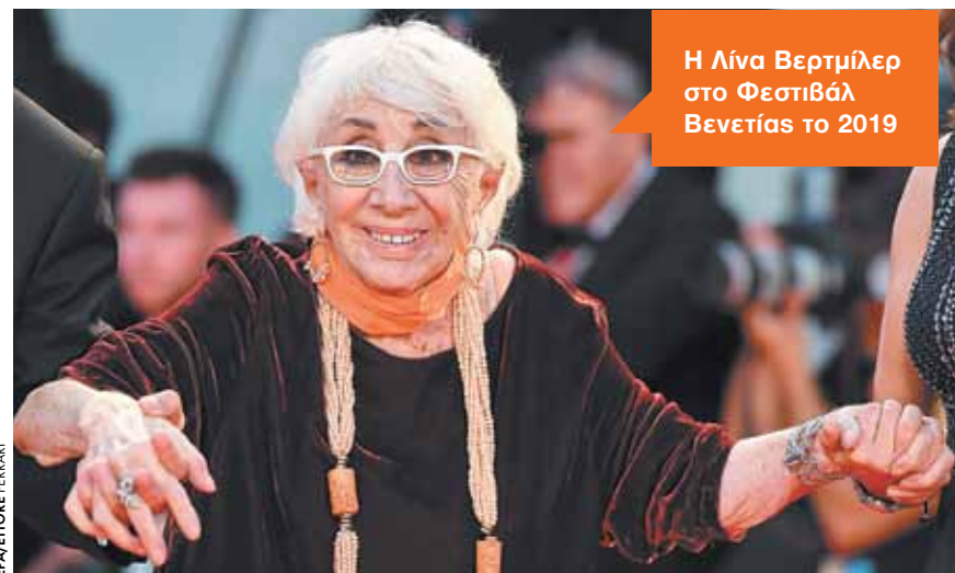
Η Λίνα Βερτμίλερ στο Φεστιβάλ Βενετίας το 2019