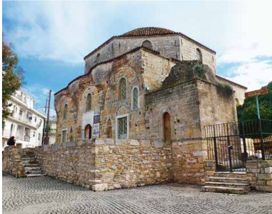
Χαλκίδα, Τέμενος Εμίρ-ζαντέ. Αποψη από βορειοδυτικά

και το μοναδικό του είδους του, το ιεροδιδασκαλείο της οδού στρατηγού Σαράφη, που ίδρυσε ο Ομέρ, ο γιος του κατακτητή της Θεσσαλίας Τουραχάν, μεταξύ των ετών 1474-1484 και το οποίο αργότερα μετατράπηκε σε φυλακές, σε λουτρό, φιλοξένησε συμβολαιογραφικό αρχείο, υποδηματοποιείο, καρβουναποθήκη και σήμερα λειτουργεί ως καφέ-μπαρ. Είναι μερικά μόνο από τα πολλά, άγνωστα στο ευρύ κοινό – κάποιες φορές ακόμα και στους κατοίκους των περιοχών όπου βρίσκονται – μνημεία που άρχισαν να χτίζονται έναν